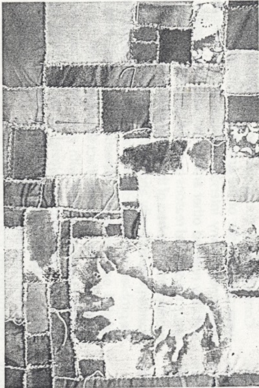
Marcel Alocco Fragment du Patchwork N° 435 . Assemblage, glycerin on cotton. 68 x 44 cm. 1989.

does all the tearing and sewing himself, and would never think of having his art stitched by anybody else. He can be seen pulling his thread and needle like the fisherman who repairs his nets.